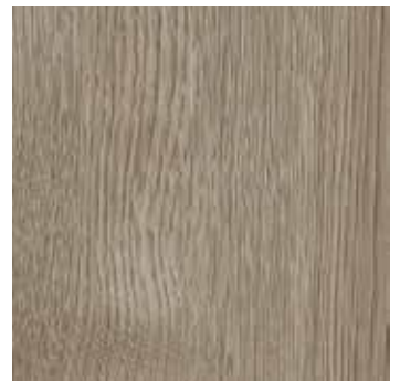
Eiche Lappland *1)