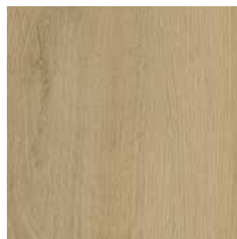
Helle Eiche Silkeborg