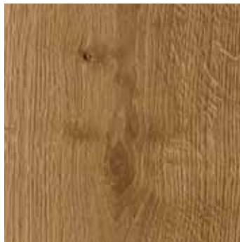
Natureiche Billund *1)