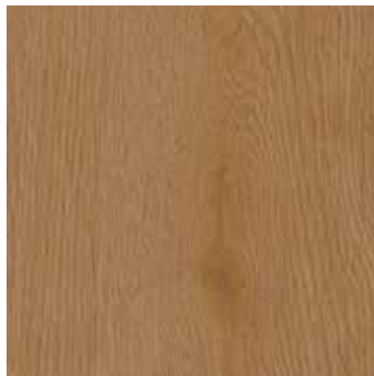
Eiche Viborg *2)