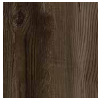
Dunkle Tanne Fano