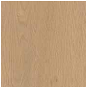
Eiche Helsinki *1)