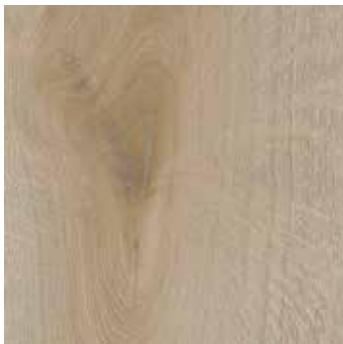
Eiche Harstad *2)