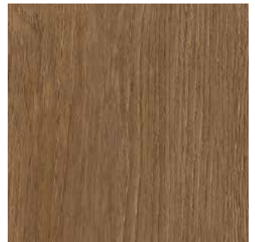
Wildeiche Ringsted *2)