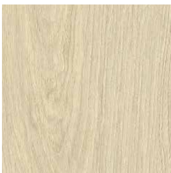
Wildeiche Nyborg *2)